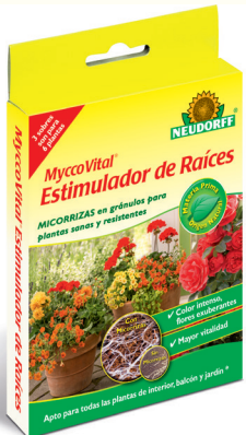
MyccoVital® Estimulador de Raíces Micorrizas