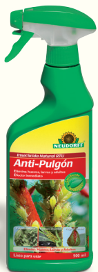
Insecticida Natural RTU Anti-Pulgón *(2)