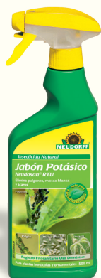
Insecticida Natural Jabón Potásico Neudosan RTU *(2)