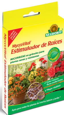
MyccoVital Estimulador de Raíces