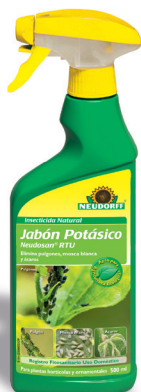
Neudosan RTU Insecticida Natural Jabón Potásico (2)