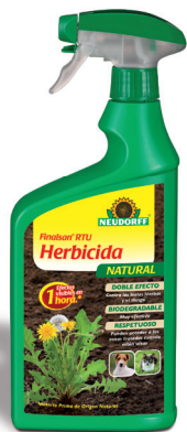
Finalsan RTU Herbicida Natural (2)