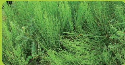
Cola de caballo de campo