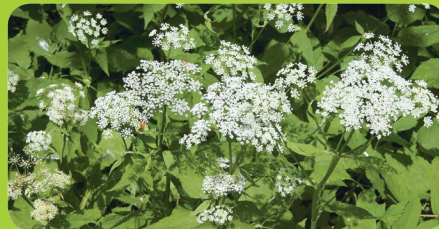
Pie de cabra