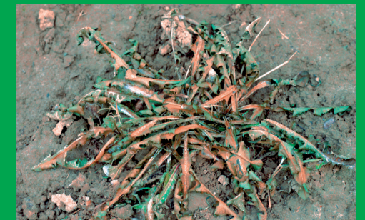
Planta tratada después de 24 horas