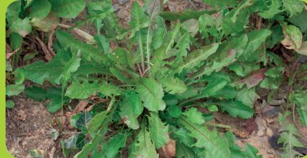
Diente de león