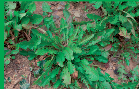
Planta sin tratar